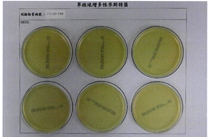
圖 2、單核球增多性李斯特菌 MOX agar 試驗結果圖