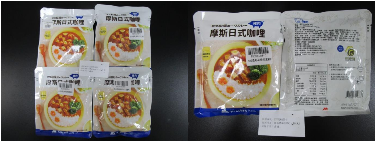
保溫試驗(第 10 天)