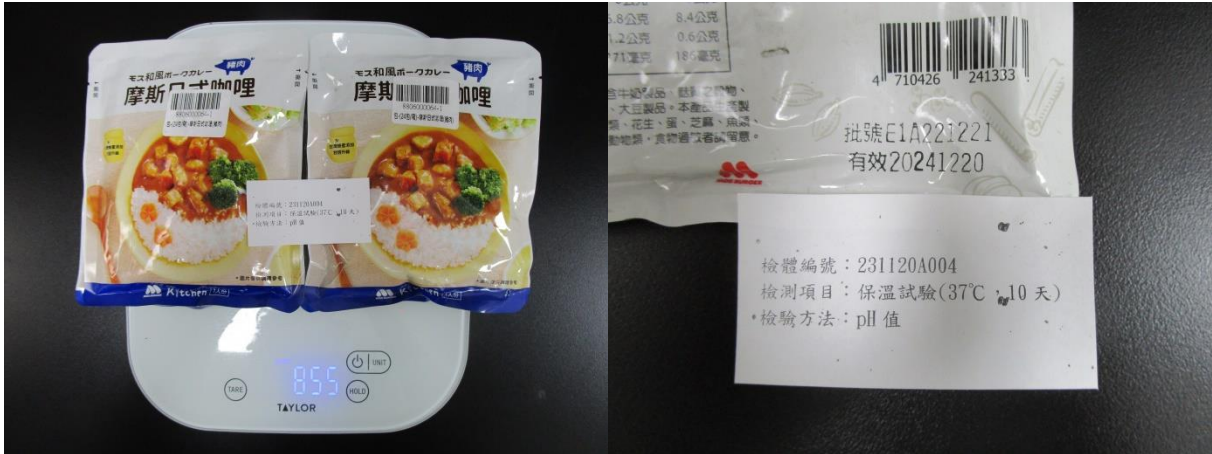
保溫試驗(第 1 天)